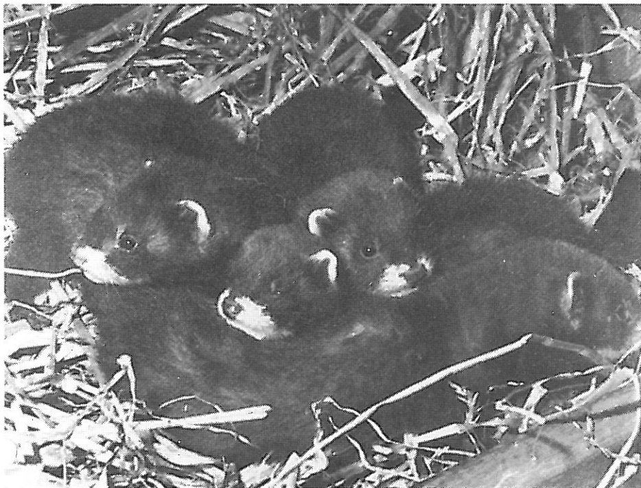
Nest jonge bunzings

bedekt de moeder de jongen met haar lichaam, en gaat alleen weg voor voedselopname en om haar behoefte te doen. Bij gevaar verdedigt zij haar kroost als een furie. De jongen zijn zeer beweeglijk en kwetteren onder elkaar. Ze worden meer dan een maand gezoogd, maar eten na drie weken al vlees mee. Gedurende de eerste weken likt de moeder hun uitwerpselen op, maar in de vierde week doen ze het al netjes op een vaste plaats buiten het nest. Ze worden nu donkerder van tint tot bijna de echte bunzingkleur, en ze worden behoorlijk uithuizig, waarbij de moeder ze telkens naar het nest terug sleept. Tijdens hun waakperiode spelen ze aanhoudend met elkaar. Onlustgevoelens worden met een schel gepiep aangegeven. Na 6 weken gaat de moeder met het hele stel op pad, waarbij van alles en nog wat besnuffeld wordt en ook het eindeloze spelen met elkaar doorgaat. Nog weer 6 weken later wordt de familieband verbroken.