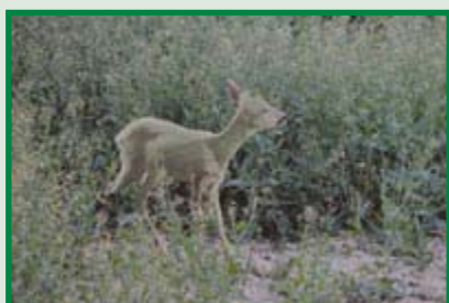
... und so sieht ein anderes Reh das Stück im Raps.

UV-Strahlung spielt aber auch bei dämmerungsaktiven Arten eine Rolle. Hirsche zum Beispiel sind nachgewiesenermaßen in der Lage, kurzwellige Strahlung bis hin zum UV-Licht wahrzunehmen. Die Tiere finden sich in der Dämmerung deshalb so gut zurecht, weil der Anteil kurzwelliger Strahlung im Dämmerlicht deutlich höher ist als am Tag.