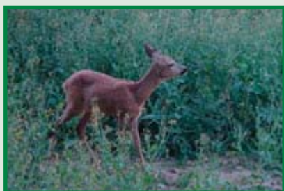
So sieht der Mensch ein Schmalreh in der Dämmerung ...