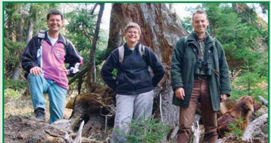
Der Autor (rechts) mit Wanderern in der typischen bunten Bekleidung wie der Mensch sie sieht.

Für die Säuger unter den Wildtieren stechen also vor allem Blautöne heraus, die wie Signalfarben wirken.