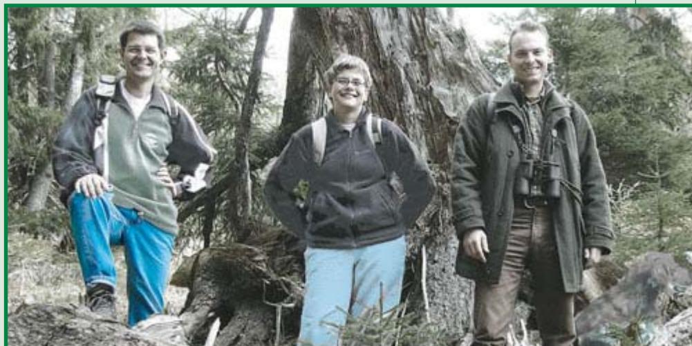
Schalenwild hingegen nimmt die Blautöne vermutlich als Signalfarbe wahr; die Rottöne (siehe auch Irish Setter) werden als grünlich-grau gesehen und die Farbe Grün wird bei relativ guten Lichtverhältnissen nicht so gut unterschieden.

Deutlich bunter ist die Welt jedoch für Vögel, die sogar bis zu vier verschiedene Farbrezeptoren besitzen. Viele Vögel sehen nämlich im ultravioletten Bereich und vermögen dadurch Purpurtöne wahrzunehmen, die der Mensch nicht kennt; sie reagieren also besonders sensibel auf Rot und Ultraviolett. Turmfalken finden Mäuse beispielsweise über deren Urinspuren, die ultraviolettes Licht reflektieren. Bei Zugvögeln wurde vor kurzem außerdem ein Molekül in der Netzhaut entdeckt, dass zur Erkennung des Erdmagnetfeldes dient. Damit sind die Vögel in der Lage, das Magnetfeld der Erde als visuellen Raster zu sehen.