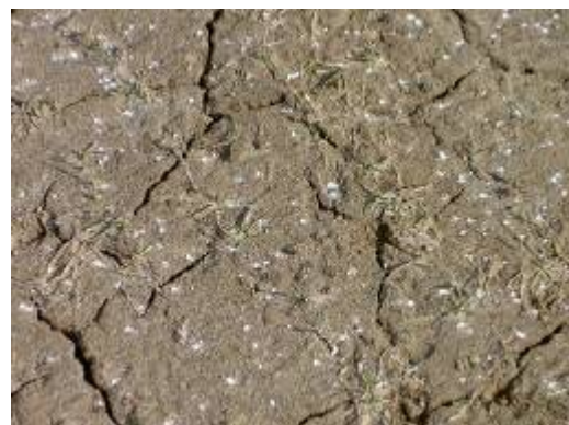
Figuur 1 en 2: Vertrapping door ganzen, 15 maart 2010