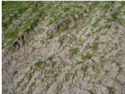
Foto 4: ganzen op perceel, 12 april 2010 Foto 5: vertrapping perceel door ganzen, 12-04-2010