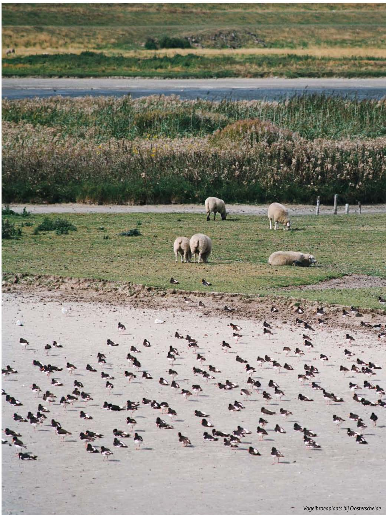
Vogelbroedplaats bij Oosterschelde