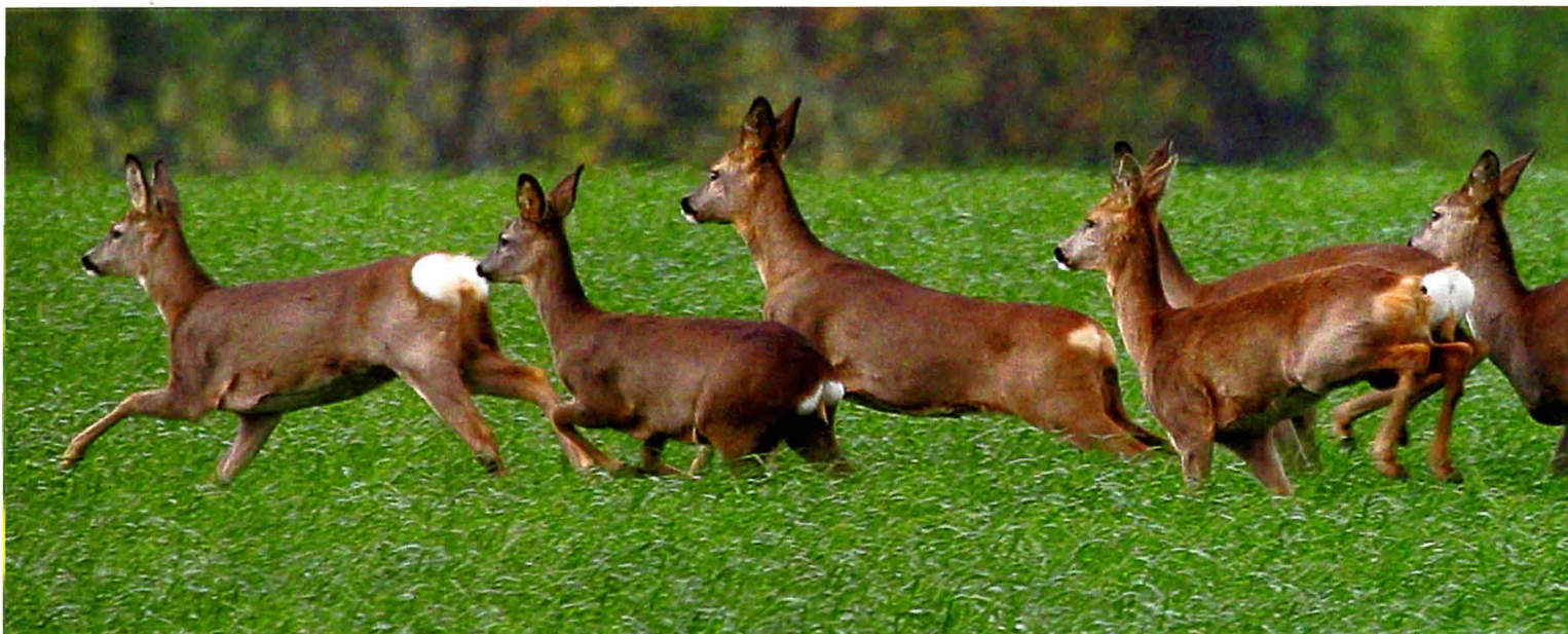
Acht weibliche Stücke und nur ein Bock. Das ungleiche Geschlechterverhältnis sorgt für einen hohen Zuwachs.

In der Schweiz gab es bereits in den 1970er-Jahren ausgesprochen viel Forschung über das Rehwild. Bekannt waren dabei die Arbeiten aus dem Zizerser Feld bei Landquart im Churer Rheintal. Das Untersuchungsgebiet umfasste 170 Hektar. Es wird landwirtschaftlich intensiv genutzt, die Deckung schwankt dort zwischen Sommer und Winter sehr stark. Zeitweise waren fast drei Viertel der Rehe markiert. Die Schweizer konnten den Bestand in dem Feldrevier daher recht gut erfassen. Auf diesen 170 Hektar lebten im Durchschnitt knapp 60 Rehe, also 34 Stück je 100 Hektar. Im Frühjahrsbestand kamen rund 2,5 Geißen auf einen erwachsenen Bock. Es ging bei der Untersuchung vor allem um die Nachwuchsrate, und man wollte verstehen, wie und wodurch der Bestand reguliert wird.