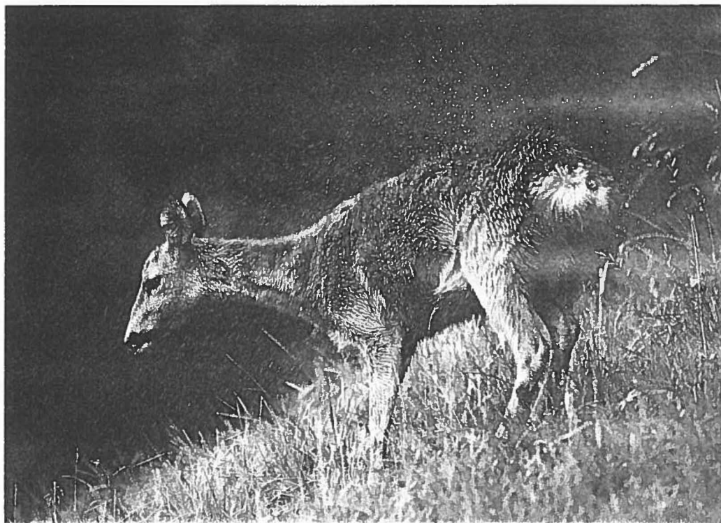
Eindeutig ist die Spinne dieser Ricke zu erkennen. Doch gerade an der Gefahr der Verwechslung von Schmalreh mit Ricke entbrennt die Diskussion um die Mai-Jagdzeit der weiblichen Jährlinge

Es spricht demnach vieles gegen die Jagd auf Rehwild im späten Herbst und Winter und viel