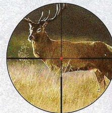
280 m-Schuss mit Absehensschnellverstellung.