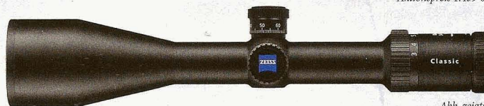
Abb. zeigt: Classic Diavari 3-12x56 T* mit ASV Aktionspreis 1.499 €