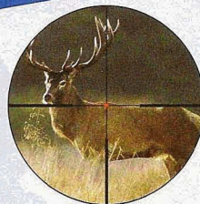
280 m-Schuss ohne Absehensschnellverstellung.

beim Kauf im Promotion-Zeitraum vom 1.10. bis 31.12.10