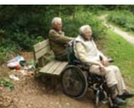
Deel 2 | Toelichting

Te weinig toezicht leidt tot verrommeling.