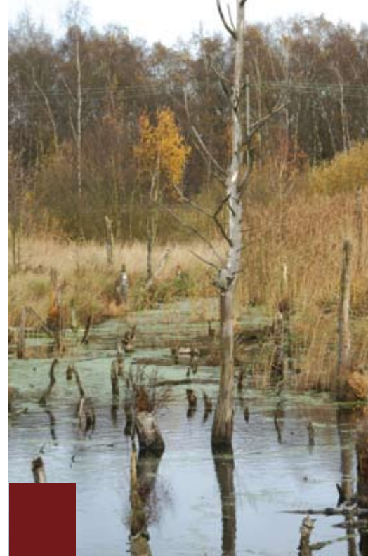
Vernatting in de Peel. De implementatie van Natura 2000 heeft nogal wat stof doen opwaaien.

De implementatie van Natura 2000 heeft de laatste jaren nogal wat stof doen opwaaien. Natura 2000 staat voor de Nederlandse aanwijzing in het kader van de Europese Vogel- en Habitatrichtlijn. In 2007 is een eerste tranche aangewezen van 111 gebieden die daarvoor in aanmerking komen. Thans wordt door de provincies en het rijk gewerkt aan de definitieve begrenzing en het opstellen van beheerplannen. Staatsbosbeheer levert een