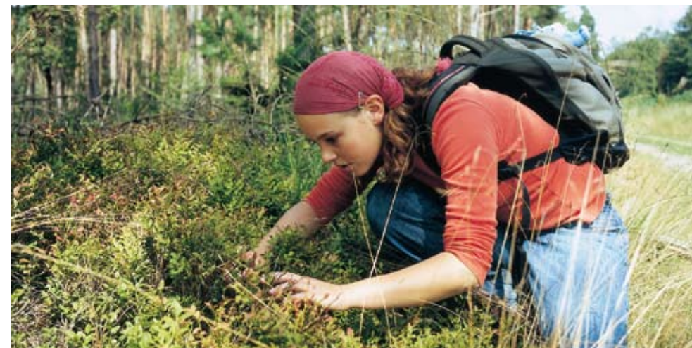
Bosbessen maken bossen tot smulbossen