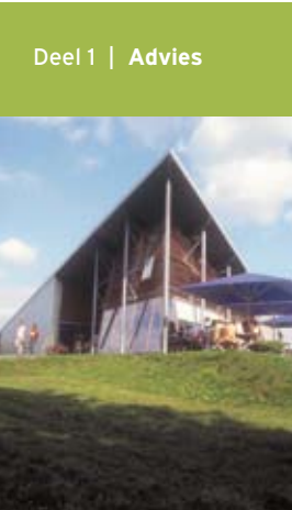
Jaarlijks komen ruim 1 miljoen mensen naar de bezoekerscentra.