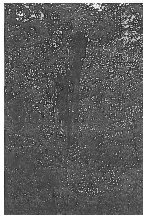
Abb. 2: Buchenverjüngung im Lichtschacht im Buchenurwald am Semenik, Rumänien

Bleibt noch die Frage, ob es Großherbivoren entlang von Flusslandschaften gelingt, den Wald dauerhaft zurückzudrängen. Die Biebrza ist einer der letzten freifließenden Flüsse in Mitteleuropa. Dort gibt es riesige, jährlich überschwemmte Feuchtwiesen mit unzähligen seltenen Tier- und Pflanzenarten. Daneben finden sich überall Spuren von Elch und Reh, seit jüngerer Zeit auch