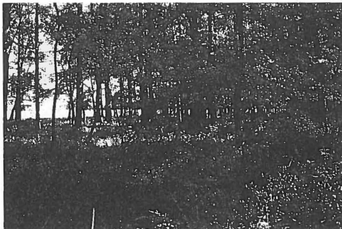
Abb. 5: Erfolgreiche Waldverjüngung in Schatten spendenden Hutewäldchen, Opeke, Kroatien