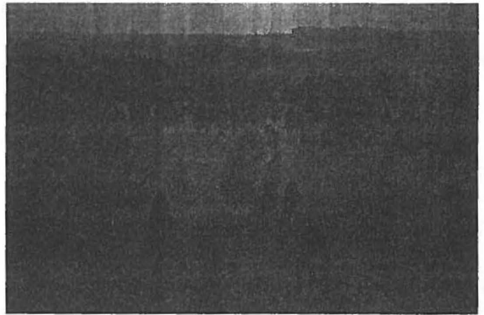
Abb. 4: Elche bevorzugen in der Biebrza in Ostpolen die Feuchtwiesen und -wälder.

Rotwild. Der Elch ist so häufig, dass gleichzeitig mehrere Tiere beobachtet werden können (Abb. 4). Sie meiden die Landwälder und stehen bevorzugt in den Nasswäldern entlang der Feuchtwiesen. Doch trotz massiver Beweidung können sie das Vorrücken des Waldes auch hier nicht verhindern. Daher ergreifen örtliche Naturschützer selbst die Säge, um wertvolle Feuchtwiesen für Seggenrohrsänger, Doppelschnepfe u.a. frei zu halten. Also selbst hier versagt der Herbivore.