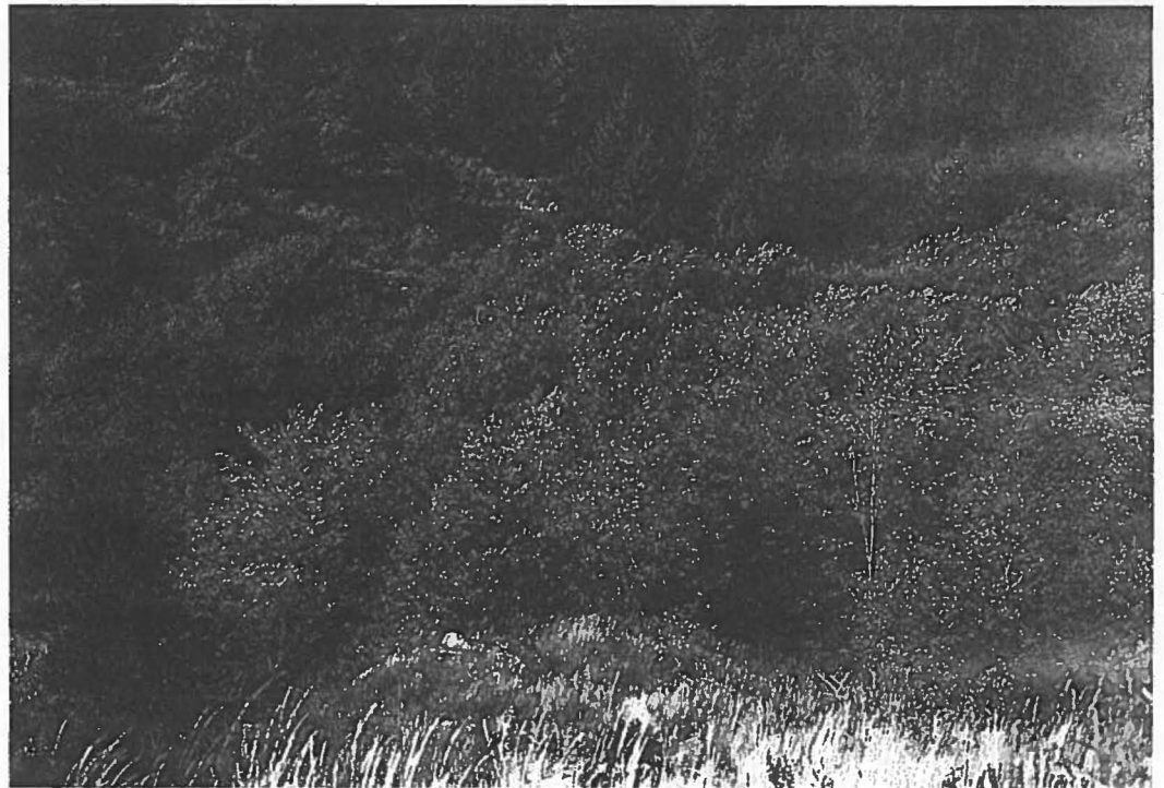
Ein geschlossener Rotbuchenwald, unter dem die Naturverjüngung steht „wie Haare auf dem Hund“, ist sicher ertragreicher als ein derartiges Mosaik (ungeachtet der Baumartenzusammensetzung), aber nicht natürlicher

Ein Ökosystem ist demnach ein System von zyklischen Prozessen, die desynchron nebeneinander laufen und viel robuster gegen Störungen sind als lineare Prozesse. So stellt der Entwicklungsgang eines Pionierwaldes aus Birken und Espen sowie anderen Laubhölzern einen Zyklus mit Verjüngungsphase, Optimal-, Alters- und Sterbephase dar, der vom Zyklus des Buchenwaldes abgelöst wird, bis sich aus dessen zusammenbrechenden Hallenwäldern wieder ein Pionierwald aus Birken und anderen Baumarten entwickelt. Je nach Lebensalter bzw. Lebenserwartung der Baumarten haben diese Zyklen unterschiedliche Dauer. Eine Buche kann 400 Jahre, eine Eiche gar 1000 Jahre alt werden. Entsprechend lange dauern die Zyklen dieser Waldbestände. Wohl gemerkt, nicht auf großer Fläche, sondern die einzelnen Phasen mehr oder minder kleinflächig räumlich eng benachbart. Es ist bei diesem Konzept auch einfach, abhängige Lebensgemeinschaften, wie z.B.