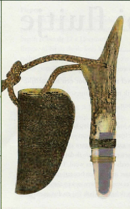
8. De Rottumtaler-Mundblatter van reegewei is de winnaar van deze test.

Rottumtaler-, Buttolo-, Reitmayr-, Weißkirchen en Jagdexperte-Mundblatter. Tussen deze vijf instrumenten bestaan bijna geen verschillen als het gaat om natuurlijke tonen en veelzijdigheid. Om het perfecte geluid te laten klinken, is bij