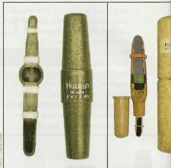
6. De Buttolo-Universalblatter van kunsthoorn vereist veel oefening.

Wie iets wil leren, heeft een leraar nodig of in elk geval studiemateriaal. Wie de mogelijkheid heeft, zou aan een seminar over de bladjacht moeten deelnemen. Voor wie thuis wil leren, zijn er Duitstalige cassettes, cd's en dvd's beschikbaar. De Reitmayr oefencassette bijvoorbeeld kost ongeveer €13,-. Op deze cassette staan handige aanwijzingen door middel van woord en geluid om de Reitmayr-Universalblatter effectief te gebruiken. Daarnaast geeft de cassette algemene tips voor de bladjacht. Klaus Weißkirchen