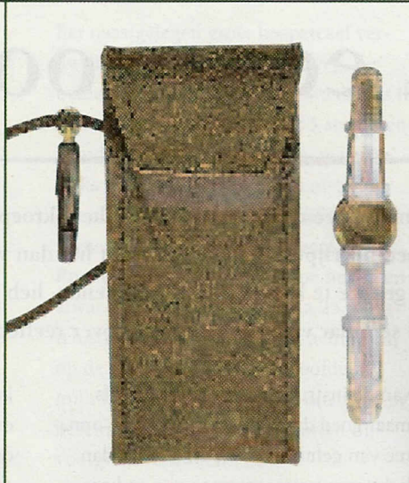
9. De Weißkirchen-Universalblatter, de basis is van Wenge hout.

Rottumtaler-, Buttolo-, Reitmayr-, Weißkirchen en Jagdexperte-Mundblatter. Tussen deze vijf instrumenten bestaan bijna geen verschillen als het gaat om natuurlijke tonen en veelzijdigheid. Om het perfecte geluid te laten klinken, is bij