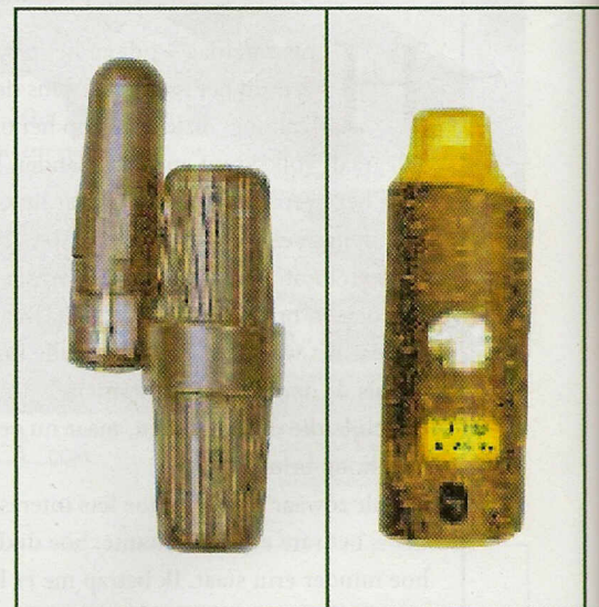
1. De kleine en lichte Wegu-Blatter.

4.1 Angstroep van kalf: Dit is een erg klein lokinstrument, waarbij van tevoren het geluid van een angstschreeuw van een kalf is ingesteld om de uit één toon bestaande angstschreeuw te laten horen. Dit is een scherpe toon, die men krachtig kort in het instrument blaast en klinkt als een korte 'i'. Na een korte pauze volgt de tweede roep, daarna in snel tempo drie tot zes volgende roepen, vervolgens enkele of dubbele tonen en uiteindelijk opnieuw zo snel mogelijk drie tot zes roepen. Met de angstschreeuw van een kalf moet zuinig omgegaan worden, gebruik hem alleen als de reebok bij de reeëit staat, omdat het de reeëit anders erg onrustig maakt. Deze fiep heeft bijna geen oefening nodig, als het gebruik van