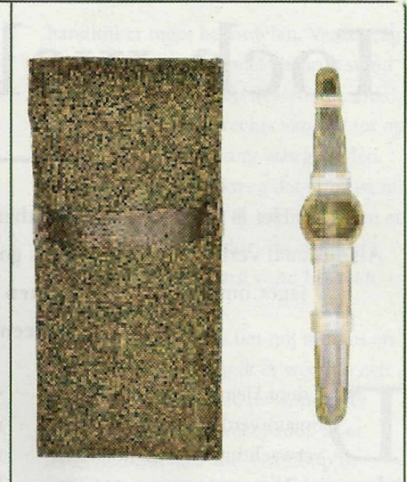
10. De Jagdexperte-Universalblatter, de nieuwste van alle geteste fiepen.

alle vijf de lokkers een juiste ondersteuning van de handen bij het moduleren belangrijk. Met deze fiepen kan men, na intensief oefenen met behulp van ondersteunend lesmateriaal, alle tonen die voor de bladjacht van betekenis zijn laten horen.