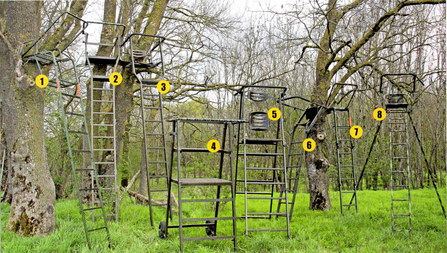
1 Askari: „Deutsche Eiche“, 2 Sedlmaier Revierbedarf: „Aluminium Ansitzleiter“, 3 Knobloch-Jagd: Alu-Baumsitz „Universal“, 4 Sedlmaier Revierbedarf: „Drückjagdbock“, 5 Knobloch-Jagd: Alu-„Ansitzbock“, 6 Seeland: „Herkules Klappbarer Rucksack-Hochsitz“, 7 Askari: „Waschbär“, 8 Klaus Urbschat: Leiter „To Go“