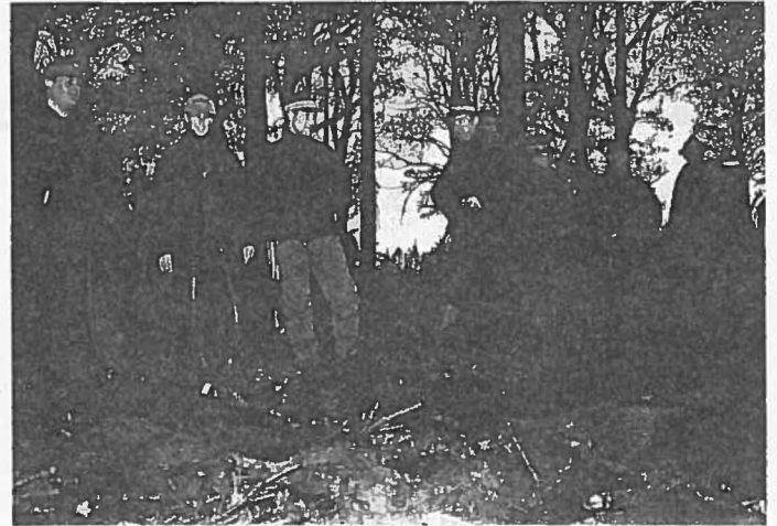
An der Strecke (rechts): 46 Sauen, drei Stück Rotwild, elf Rehe und zwei Füchse liegen am Ende dieses Jagdtages im Reinhardswald. Das ist auch der Erfolg der Stöberhundgruppe