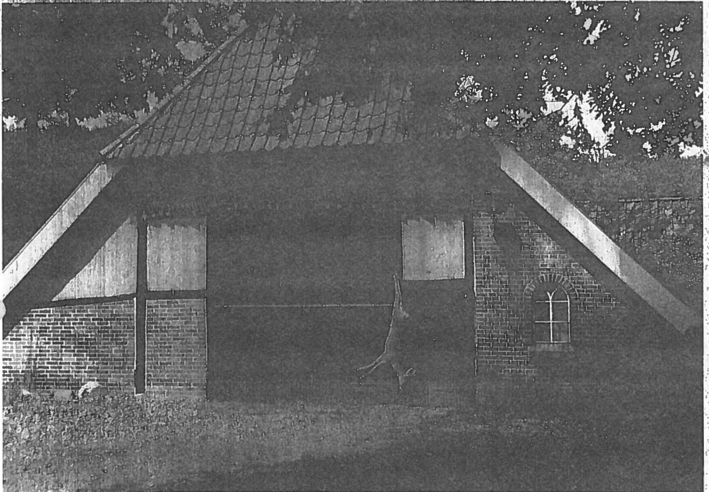
So sieht die Wildkammer heute aus. Davor hängt der Bock des Verfassers, den er anlässlich einer Einladung der Stiftung Twickel erlegt hat

auf deiner Spur in Richtung Dorf. Auf dem Dorfweg aber kamen sie auf die falsche Spur, weil Ochsenkarren zu den Feldern gefahren waren“, berichtete sein Bruder aufgeregt.