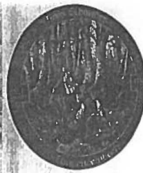
WILDERER und ihr Schicksal

Im Dorf schlug ein Hund an. Franz hatte deutlich gesehen, dass der Zweiundzwanzig-Ender sich auf die Hinterläufe stellte, aber das Mündungsfeuer und der Rauch des Schwarzpulvers hatte weitere Beobachtungen unmöglich gemacht. Bisher war alles gut vonstatten gegangen. Franz hielt die Luft an. Das Rudel war pras-