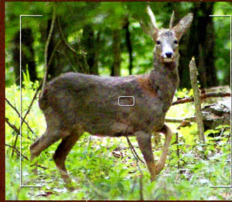
2011 Das letzte Foto Ende April

auszumachen. Der Gang war schwer und vorne rechts schonte er. In den Einstandskämpfen hatte er ziemlich Federn gelassen.