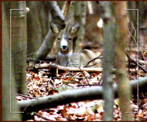
2011 Deutlich hat der Bock abgebaut.