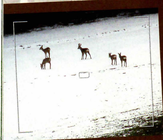
2006 Der Blessbock als 3- bis 4-Jähriger in der Mitte