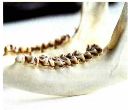
Der Unterkiefer des Blessbockes lässt nicht unbedingt einen Rückschluss auf das Alter zu.

richtig brannten, hatte die Brackenhündin des Jagdgastes die Beute bereits in der Nase. Eine saubere Kugel hatte den Blessbock im letzten Licht schnell und schmerzlos im Feuer gefällt.