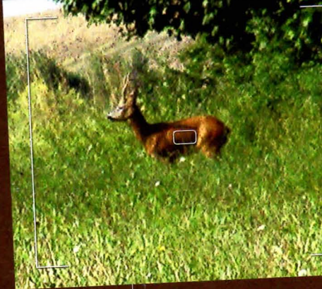
2008 Auf dem Höhepunkt seiner Entwicklung

Oft hatten die Kuhns auch Jagdgäste. Wurden diese in dem kleinen Reviereteil, in dem der Blessbock seinen Einstand hatte, angesetzt, hatten diese meist schon so viel von dem sagenhaften Bock mit dem weißen Gesicht gehört, dass es ihnen kaum eingefallen wäre, diesen reifen Bock zu erlegen. Jeder wusste, dass er sich den Unmut der Familie zugezogen hätte, und das wollte bei diesen gastfreundlichen und offenerzigen Bewohnern des Hubertushofes keiner riskieren.