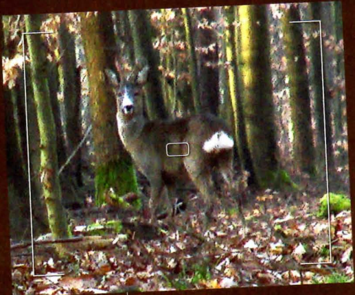
2007 An Wildbret und Gehörn noch mal zugelegt