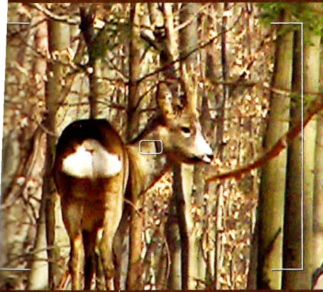
2010 Noch stark im Wildbret, aber leicht zurückgesetzt