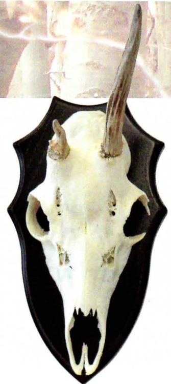
Das Gehörn des mindestens 8-jährigen Bockes zeigt verjüngende Rosenstöcke und eine stark verwachsene Stirnnaht.

Größenvergleich: Der Blessbock (l.) wog aufgebrochen 18 Kilogramm, der Jährling 12,5 Kilogramm.